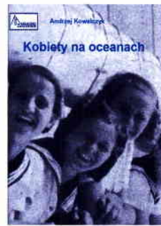
Andrzej Kowalczyk Kobiety na oceanach Miniatury Żeglarskie zeszyt 5 Wydawnictwo Andrzeja Kowalczyka, 2018 str. 68, cena 10,00 zł

przeczytać. Zabrakło wprawdzie wiadomości o udziale damskich załóg w regatach dookoła świata, samotnego kobiecego pokonania Przejścia Północno-Zachodniego czy etapowego rejsu wokół globu ze zmieniającymi się żeńskimi załogami. Każdy jednak, kto w polskojęzycznej literaturze będzie szukał informacji o żeglujących kobietach, powinien zacząć właśnie od tego wydania miniatur morskich. Nie przypominam sobie bowiem, żeby gdziekolwiek zostało zebranych tyle