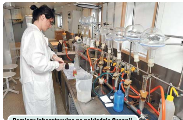
Pomiary laboratoryjne na pokładzie Oceanii