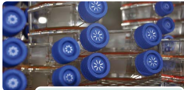
Naczynia hodowlane dla komórek będących modelowymi obiektami badawczymi w projekcie

Brak reakcji na leki przeciwnowotworowe to jedna z głównych przyczyn niepowodzeń chemioterapii. Za powstanie tego zjawiska odpowiadają białka, które aktywnie usuwają leki ze zmienionych chorobowo komórek. Niektóre z nowotworów wykazują pierwotną oporność na stosowane farmaceutyki, inne nabywają cechę niewrażliwości podczas chemioterapii. W efekcie leczenie nie przynosi oczekiwanych rezultatów, co przyczynia się do wysokiego odsetka zgonów.